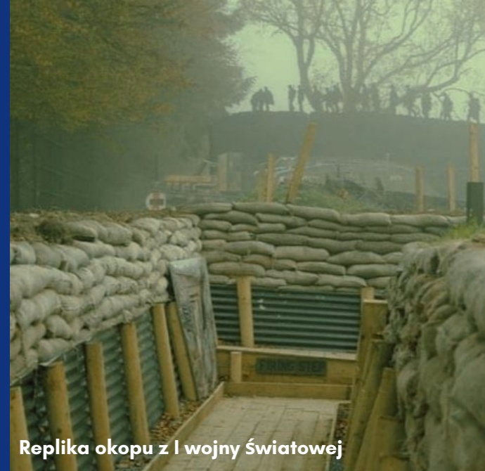
Replika okopu z I wojny Światowej