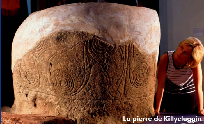
La pierre de Killycluggin