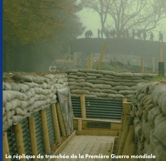
La réplique de tranchée de la Première Guerre mondiale