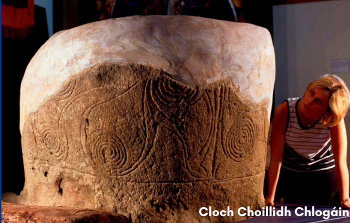
Clach Choillidh Chlogáin