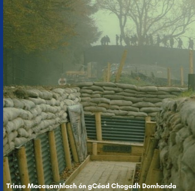
Trinse Macasamhlach ón gCéad Chogadh Domhanda